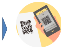
▲店頭にあるQRコードを読み取り