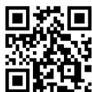
▲公式ホームページ

※ 使えるお店の情報は、MINAKAMI HEARTの公式ホームページから、使えるお店一覧をご確認ください。