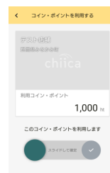
▲支払金額を入力、スライドして確定!