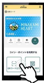
▲QRコード読取をタッチ